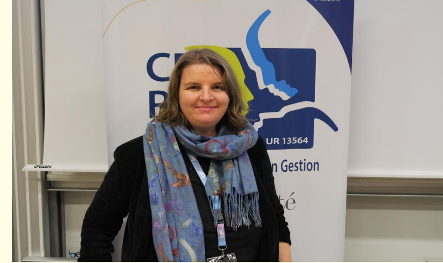
Table ronde “Qualification CNU”

Une table ronde Qualification CNU (Sections 06 et 71):